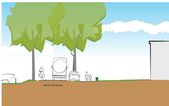
Principe Profiel D Bestaand-Toekomstig