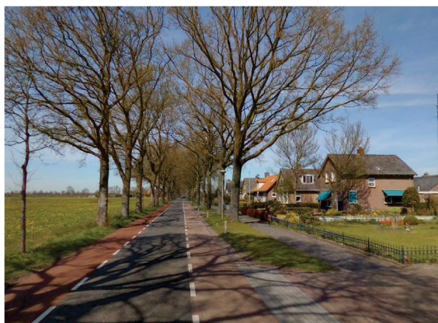
Visualisatie profiel D Bestaand-Toekomstig

Bestaande tuin Afstand tot aan woning(en) ca. 15m.